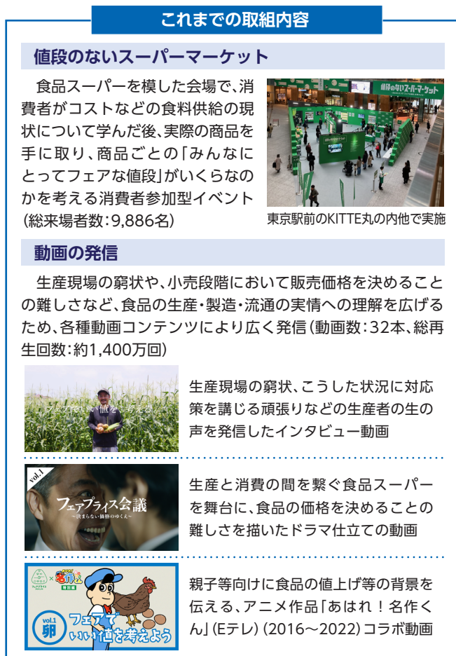
図表2 フェアプライスプロジェクト(消費者理解の醸成)

消費者向けイベントでは、原材料や肥料・飼料等の資材の高騰等、農林水産業・食品産業を取り巻く厳しい現状をパネル展示したうえで、これらを踏まえて持続的な食料供給を実現するためには、食品をいくらで購入するのが良いかを消費者自身で考え、考えた値段で実際に食品を購入することもできる「値段のないスーパーマーケット」を実施しました。参加者からは「展示内容やコンセプトがユニークで面白いと感じた」、「みんなが幸せに暮らすにはどうしたらよいか、子どもと話せたのがよかった」などの評価をいただいたため、広くこのイベント内容を気軽に体験してもらえよう、Web体験版を農林水産省のウェブサイトで公開しています。また、2025年度は品目を豆腐に絞り、原料の大豆の生産から販売までのサプライチェーンの流れと各段階でのコストの費目を展示し、消費者に値付けをしてもらう「値段のない豆腐屋さん」といったイベントも開催しました。「豆腐ひとつにしても色々な工程がありコストがかかっている事がわかった」や「豆腐に限らず色々な食べ物の値段をちゃんと考えなくてはいけないと思った」など、好意的な評価をいただくことができたと考えています。