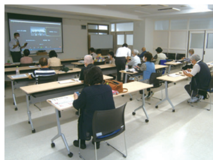
写真 スマホ教室のようす

11月11日は、コロナ禍で急速に普及したオンライン会議システムを体験しました。BBSの協力により、仙台市と横浜市に住む人との交流を体験し、その後の交流につなげることも想定してSNSの使用方法やリスクについても学びました。