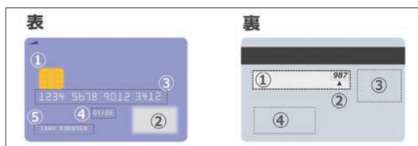
図1 クレジットカードの表示内容(例)

最近はカードレスタイプも増えていますが、依然としてカードが発行されるタイプが主流で