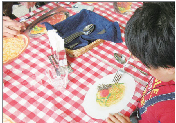
写真2 「レストランで食事をしよう」の授業で注文した料理を食べるまねをする児童

を用います。例えば、模擬パン屋での買い物は、弾力ある素材でできた食品サンプルのパンをトングでトレーに載せ、本物のレジで会計します。