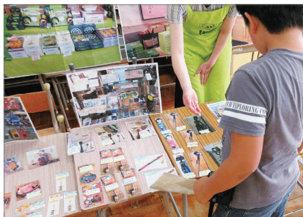
写真1 「修学旅行のお土産を買おう」の授業で土産を選ぶ児童

「修学旅行」の授業は、実際に持参する小遣いと同額の予算で、土産を買う疑似体験です(写真1)。児童は誰に何をかうか計画を立てて買い