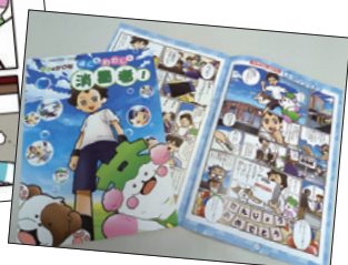
小学生向け小冊子