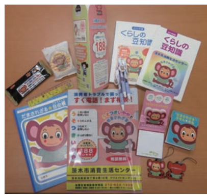
だまされざるの啓発グッズ

これからも、愛くるしいだまされざるとともに、消費者被害の防止や市民の皆さんにセンターを身近に感じてもらえるよう一丸となって取り組んでいきます。