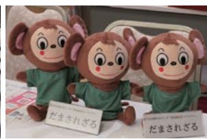
だまされざるのパペット

その他のイベントでは、消費生活展をはじめ、消費生活パネル展、消費者月間記念講演会、追手門学院大学の学園祭や地域の文化展など、さまざまな場面で大活躍しています。