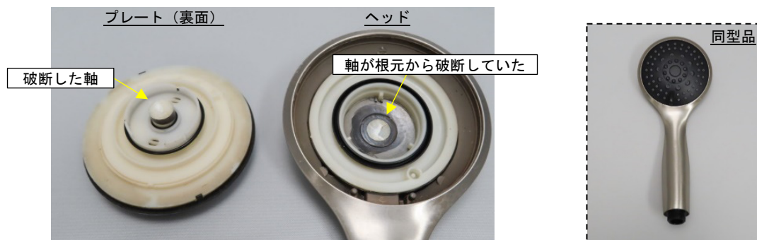
写真1. 当該品の外観

当該品は、吐水口のあるプレートを回転させることで、ミストや頭皮に刺激を与えるスカルプといった5つの吐水モードを切り替えることができる多機能シャワーヘッドでした。なお、当該品はプレートをヘッドに固定していた軸が根元から破断していました（写真1参照）。