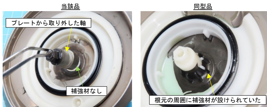
写真3. 当該品とその同型品の補強材の有無

なお、同型品を分解したところ、軸の根元の周囲には等間隔に並んだ8個の補強材が設けられており、当該品とは形状が異なっていました（写真3参照）。