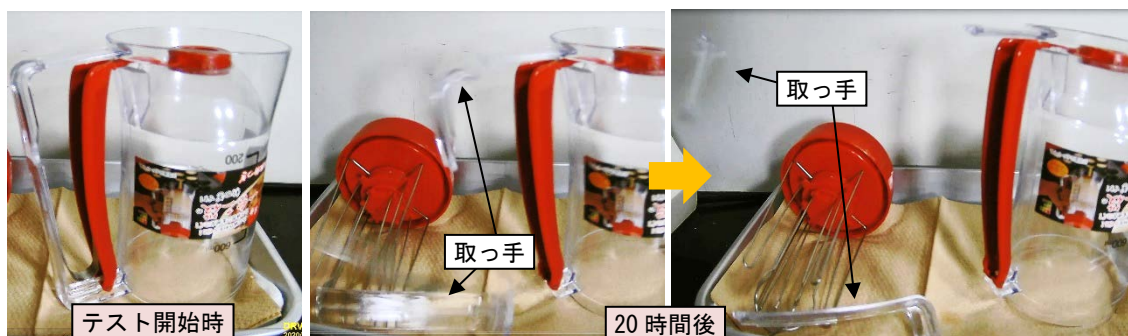
写真3. 取っ手破損の瞬間

スポンジを使って容器の内側、外側、グリップ、取っ手を水洗いして布巾の上に置くテストを行いました。その際、たこ焼きをするときに使用される油脂として可能性の高いサラダ油を取っ手に付着させ、洗剤を使用せずに水洗いしたところ、20時間経過後に大きな音とともに取っ手が破損し、取っ手の破片と板バネが飛散しました（写真3）。なお、破損部の亀裂の起点部には当該品同様、ソルベントクラックに特有の平坦で鏡面状の破面がみられました。