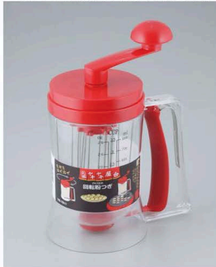
【YR-7811「元祖ヤキヤキ屋台回転粉つぎ」】