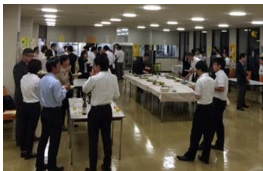
昨年の懇親会の様子

受講料等： ・受講料…9,000 円（税込） ・懇親会費…2,000 円（税込）※ 軽食、飲み物 ・宿泊料…1 泊：3,830 円（税込） ・食 事…朝食 350 円、昼食 550 円（税込） （例）宿泊、懇親会、朝食、昼食を申込んだ場合…総額 15,730 円（税込）