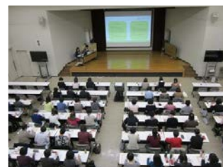
過去の実施の様子