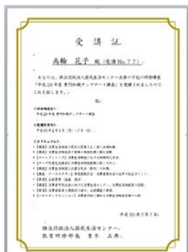
昨年度の受講証(イメージ)