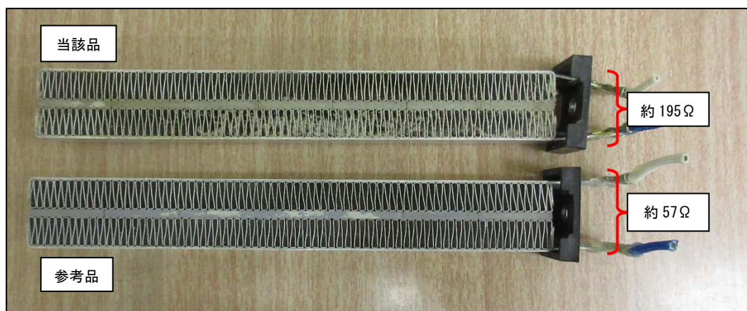
写真. ヒーターの外観

当該品と参考品を分解して確認したところ、いずれもほぼ同じ構成で、電気回路やその構成部品等に違いはありませんでした。次に、当該品と参考品のヒーター部の調査を行ったところ、当該品には埃の蓄積がみられましたが、ヒーター自体の外観及びX線透過画像による差異はみられませんでした。しかし、抵抗値を測定すると、参考品は約 57Ωであったのに対し、当該品は約 195Ωと差がみられました(写真 参照)。なお、通電時のヒーター端子には、いずれも AC100V の電圧が加えられており、差異はありませんでした。