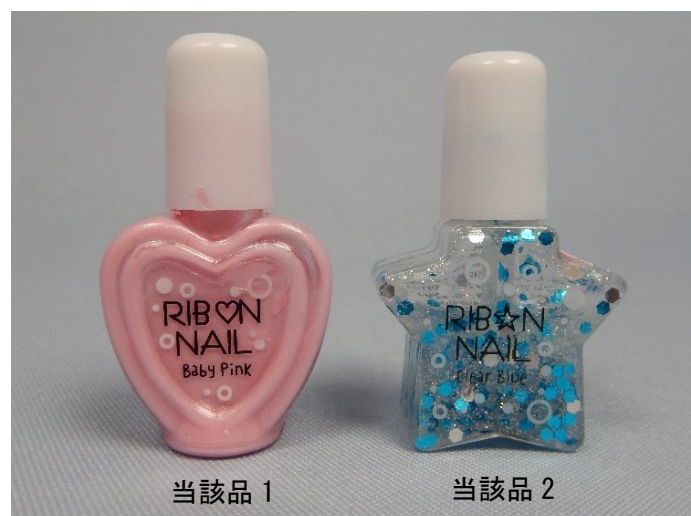
写真. 当該品の外観

12 歳女兒は当該品 1 と 2 をそれぞれ別の指の爪に、5 歳女兒は当該品 1 のみを 2 本の指の爪につけたところ、2 人とも当該品 1 をつけた指の爪のみが白くなり、しばらくすると爪が剥がれてしまったとのことでした。