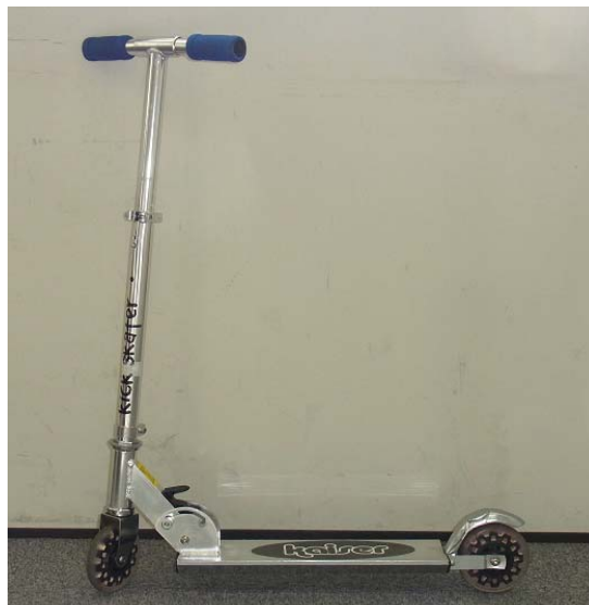
写真 1. 外観

当該品は、折りたたみができる「キックスケーター」であり（写真 1）、取扱説明書には体重 40kg 以上の方は使用しないで下さいとの記載がありました。