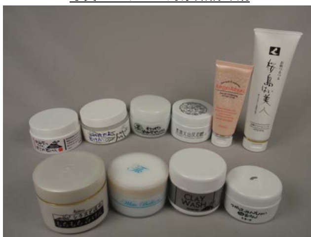
写真3. テスト対象銘柄外観