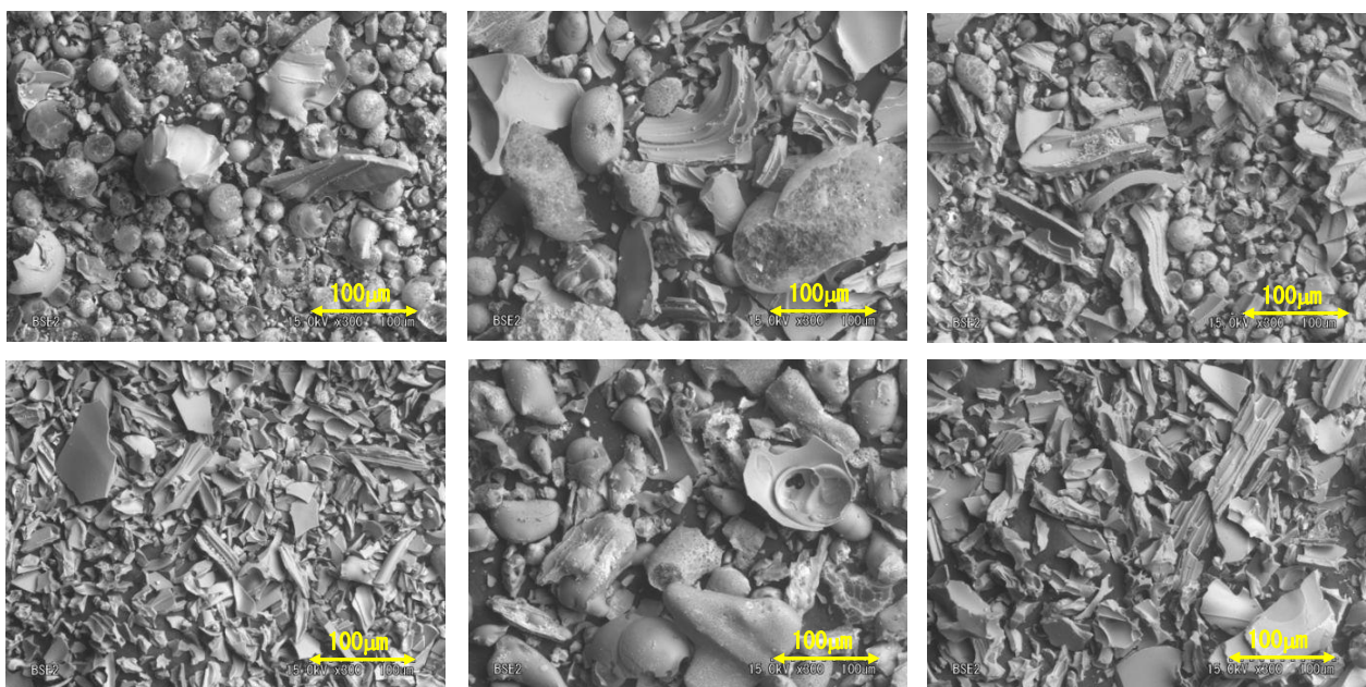
写真1. 不溶性成分の顕微鏡写真（例、写真は全て異なる銘柄）

（注9）松原稔：結膜異物の研究．眼科臨床医報 85(9)：2253-2260，1991