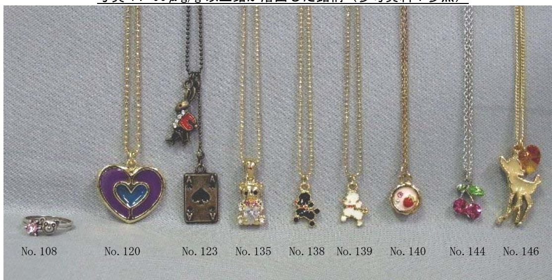
写真1. 90 \mu g/g以上鉛が溶出した銘柄(参考資料1参照)