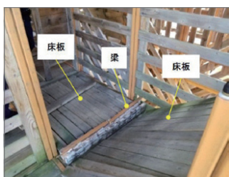
写真2 梁と床板が落下した直後の状態

してどのような法規制があるのかを確認したところ、建築基準法や消防法の適用がないとされ、安全管理は事業者任せとなっていました。また、木造立体迷路だけでなく、遊園地一般についての法規制が存在しないということも分かりました。このような事案こそが、委員会の存在意義になると考えられ、問題解決が必要です。