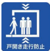
図3 戸開走行保護装置設置済みマーク

用を達成して再起動をめざしています。エレベーターにバックフィットを求めることはできませんが、その寿命は25年から30年といわれており、大規模なリニューアル工事が行われます。このタイミングで戸開走行保護装置が設置されれば、30年でバックフィットは完了となります。ところが、大規模なリニューアル工事でも既存不適格は適用されますので、工事を発注する所有者が希望した場合にのみ設置され、エレベーターには図3のようなマーク(シール等)が貼付されます。設置の義務づけが始まってから、寿命の半分ほどが経過した2023年1月の国土交通省の報告によると、設置率はわずか32%です。財政支援も行われていますので、エレベーター所有者のご理解をいただきたいところです。